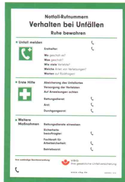
Vordrucke gibt es auch unter: www.vbg.de

Zur ordnungsgemäßen Führung einer Golfanlage gehört ferner das Vorhalten eines Spritztagebuches und eines Gefahrstoffverzeichnisses, für die der DGV-Umweltberater Vordrucke bereithält, sowie entsprechende Unterweisungen der Mitarbeiter und der Aushang von Arbeitsanweisungen, wie es beispielsweise im Marine Golf Club Sylt e.G. gehandhabt wird.